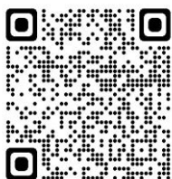
TABLEAU D'AFFICHAGE OFFICIEL NUMERIQUE (PAO)