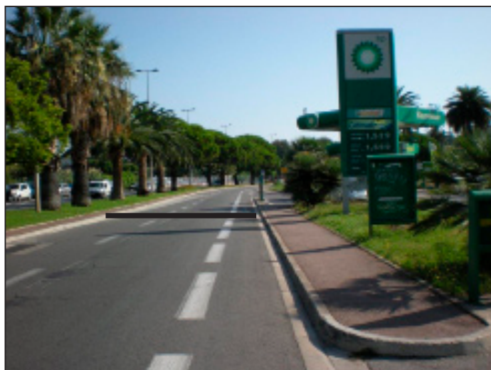
Début Zone Etalonnage Antibes avenue 11 Novembre face station BP Point GPS : 43°35'290 N 007°07'312 E